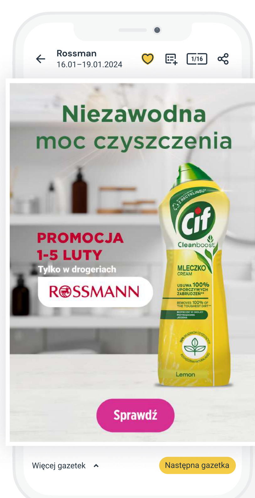
AdInsert w Gazetkowo