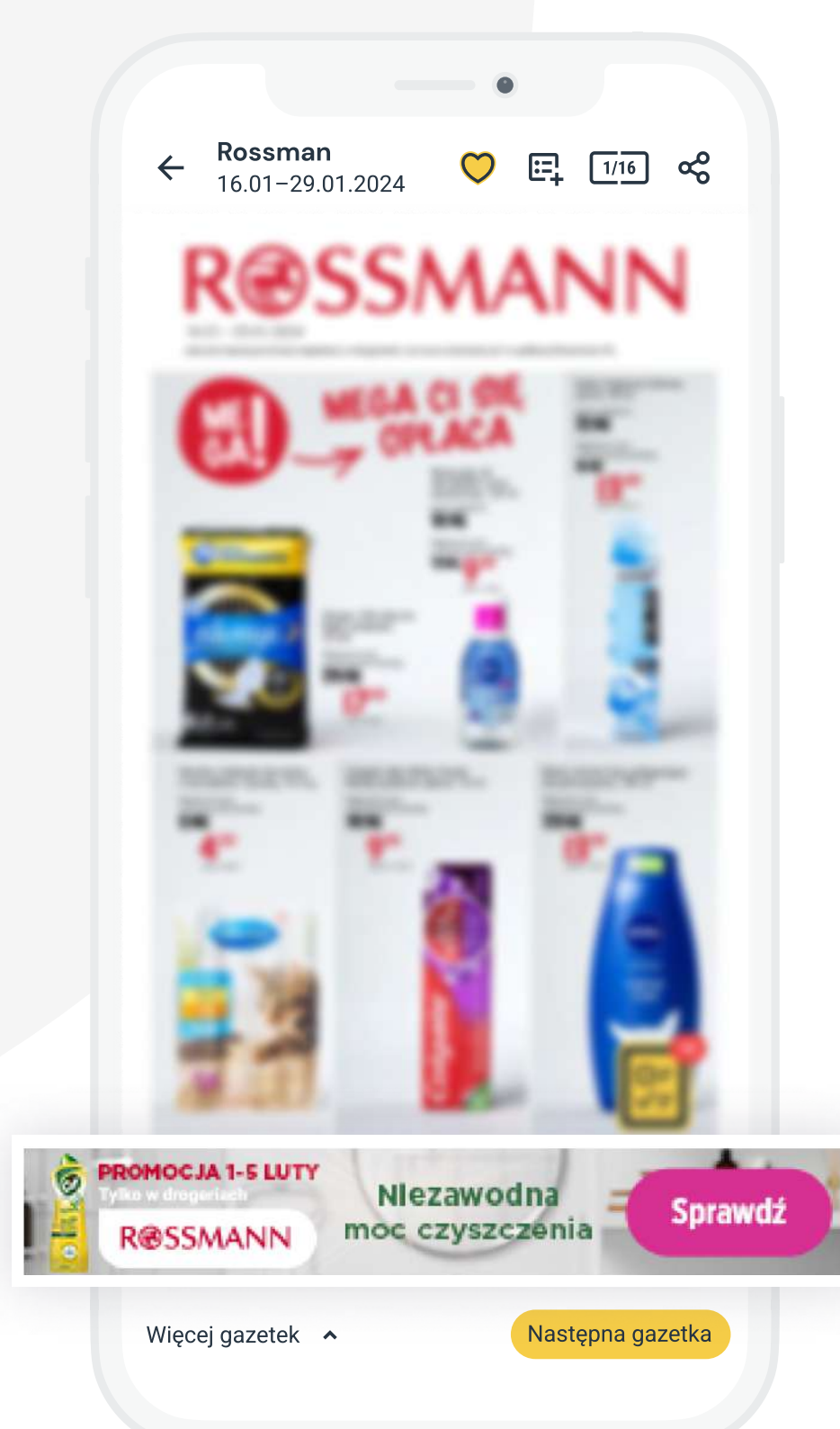
Reklama typu banner w Gazetkowo